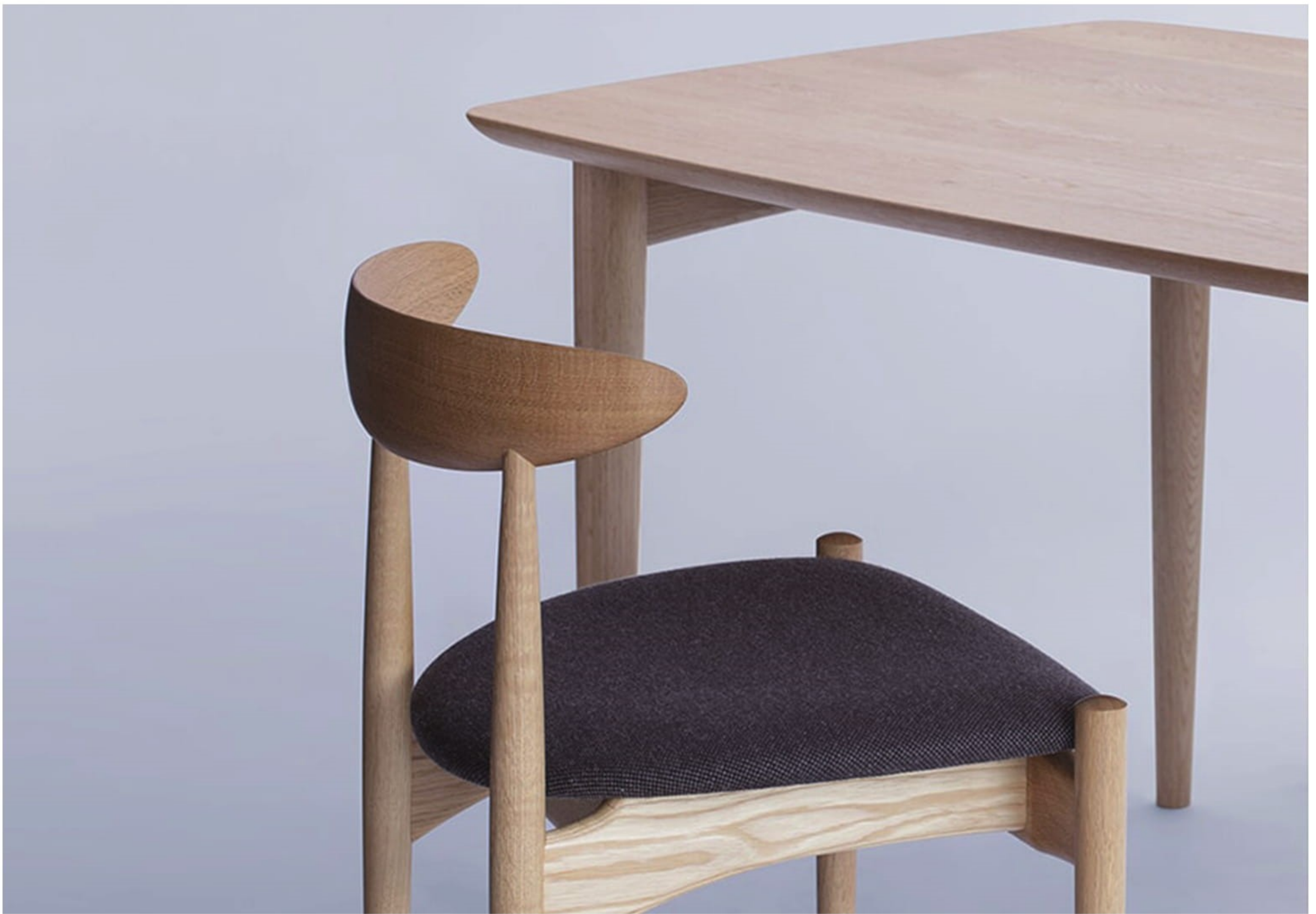
Swallow シリーズの椅子とテーブル