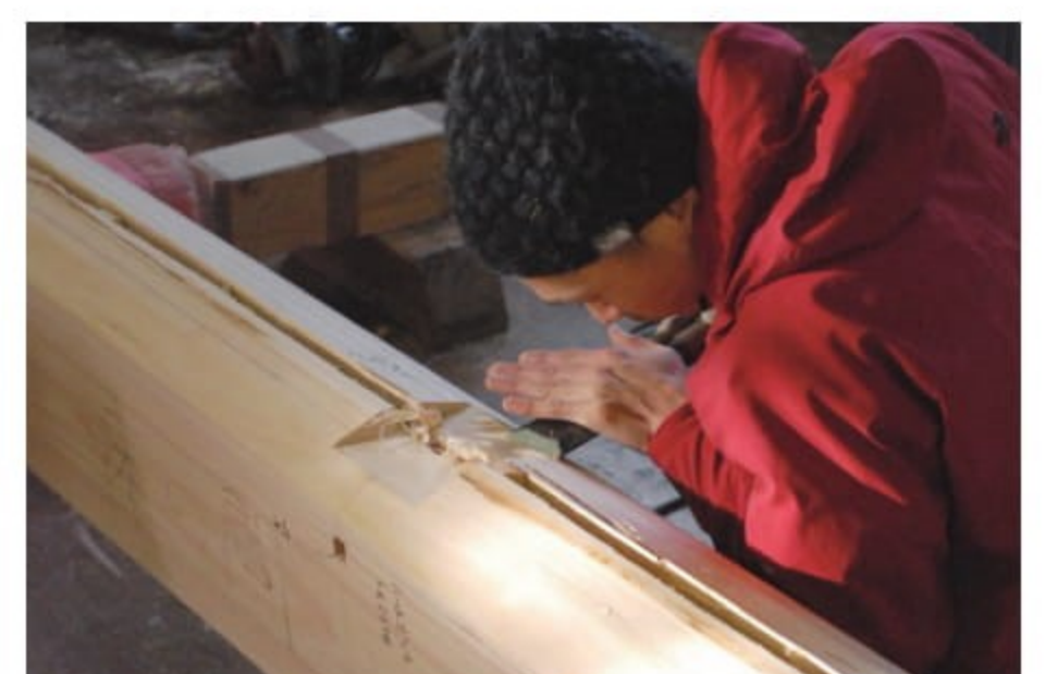
職人による手刻み